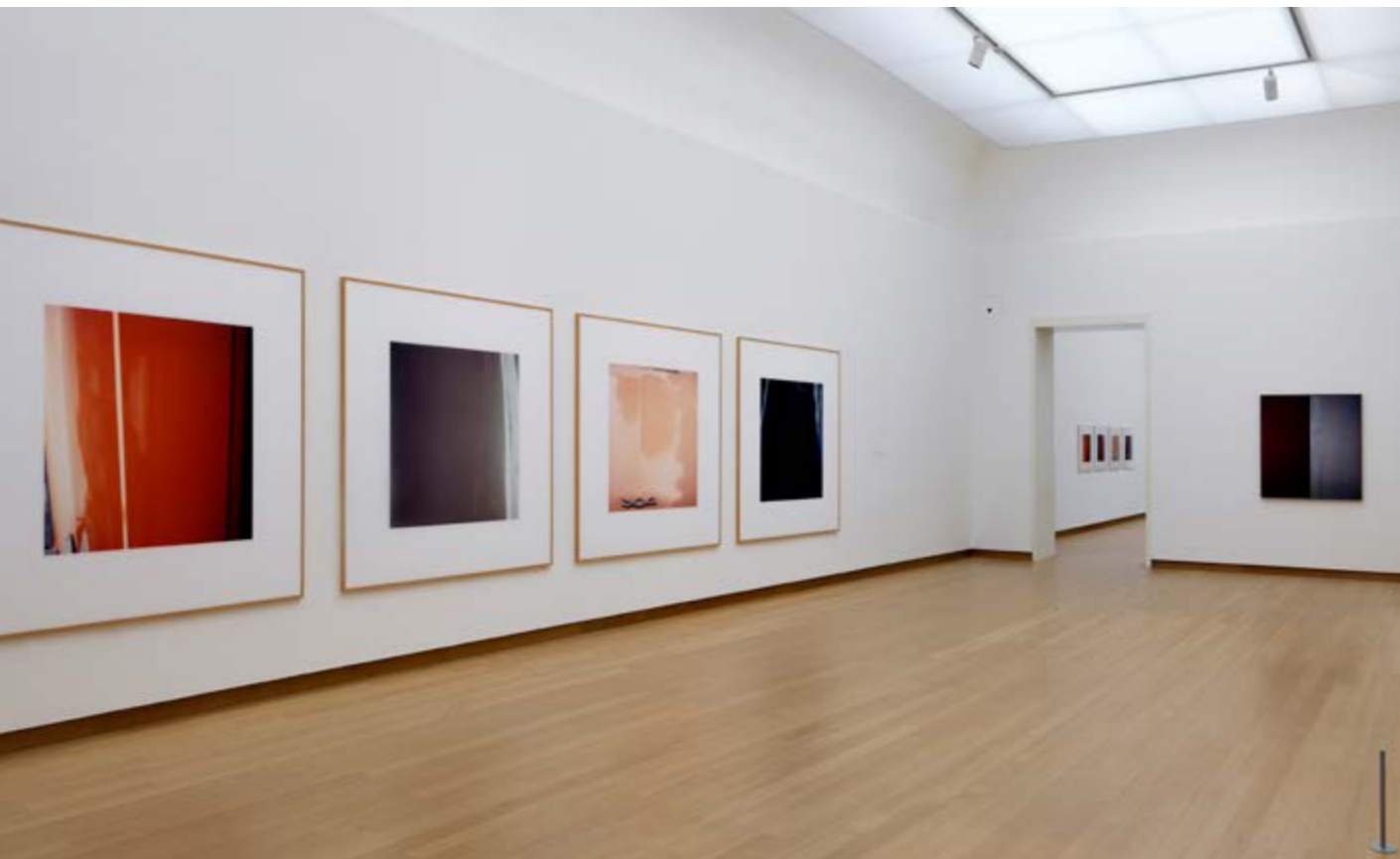
Jan Dibbets, Colour Study C1 t/m C4. In tentoonstelling: Jan Dibbets - New Colour Studies, Stedelijk Museum, Amsterdam